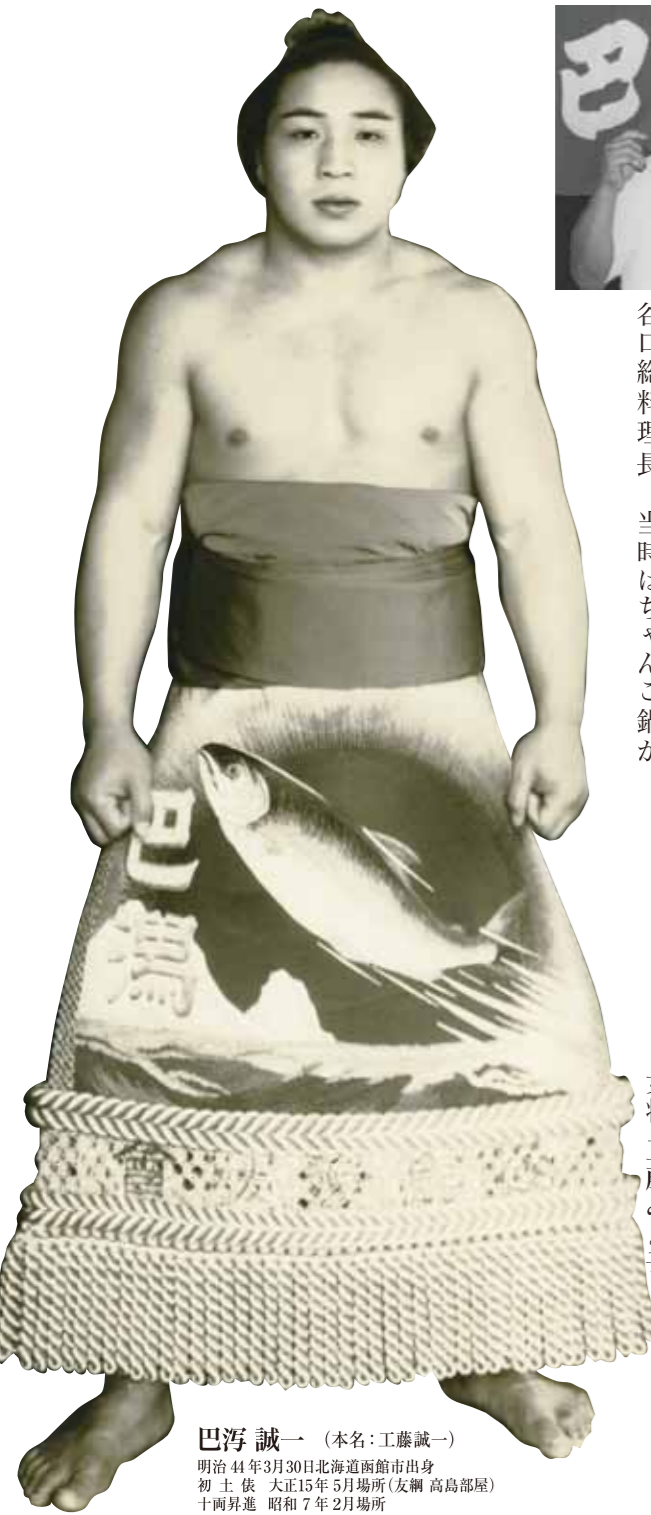
巴浮 誠一 (本名: 工藤 誠一) 明治44年3月30日北海道函館市出身 初土俵 大正15年5月場所(友綱 高島部屋) 十兩昇進 昭和7年5月場所 入幕 昭和7年5月場所 幕内在位 18場所 昭和15年5月 現役引退 昭和36年5月 9代目友綱襲名 昭和51年3月 相撲界を引退 昭和53年12月24日 死去