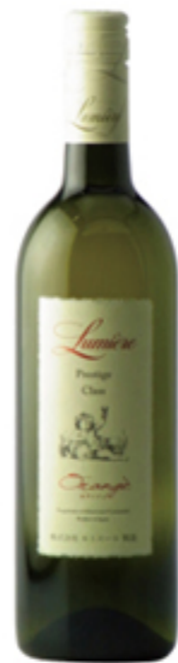
プレステージクラス オレンジ 2013

軽やかなタンニン(渋み)をお楽しみください。さらに、石蔵発酵ならではの独特なフレーバーと舌触りが合わさり、口の中で複雑な味わいが楽しめるワインです。肉をメインにするそつぷ(醤油)味の太刀山ちゃんこはもちろんのこと、巴渚名物の横綱級の大串「若鶏串焼」やあんこ型の「鳥つくね焼」のタレを使った料理にもとても合います。濃いめの味付けには「石蔵和飲」をお薦めいたします。