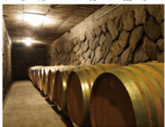
樽の中で熟成されるワイン

そこで、皆様にワインの魅力をもっとお伝えするために、山梨県の老舗ワイナリー、シャトー・ルミエールさんを取材してきました。ワインの聖地と呼ばれる山梨県には、現在約80社を超えるワイナリーがあります。ルミエールさんがワイナリーを構える甲府盆地の東側(峡東地区)には、大小合わせて70社ものワイナリーがあるそうです。