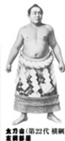
太刀山(第22代 横綱) 友綱部屋