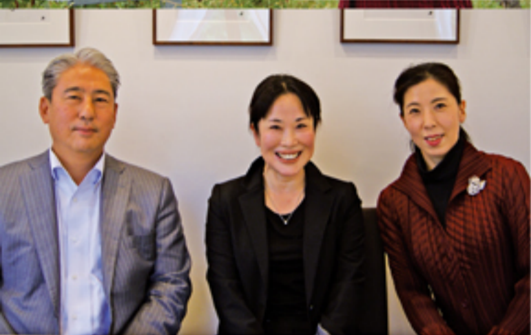
「ゼルゴバ」にてワインを囲みながら会食