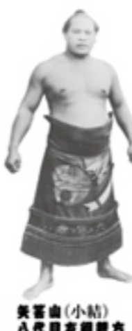
矢筈山(小結) 八代目友綱部屋