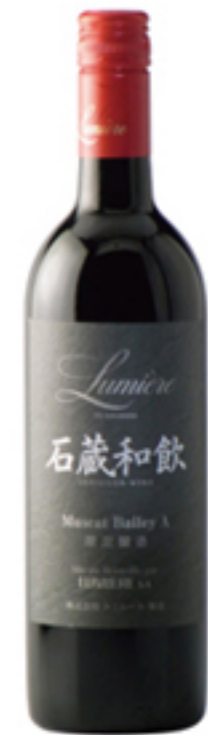
石蔵和飲 マスカットペイリーA2012

一つは、「石蔵和飲 マスカットペイリーA2012」。明治34年に花崗岩の石材で構築された「石蔵醗酵槽」の中で醸造した赤ワインです。石蔵でつくられたワインは、独特のフレーバーと舌触りが特徴です。「マスカットペイリーA」の持つ、イチゴのような優しい香りと