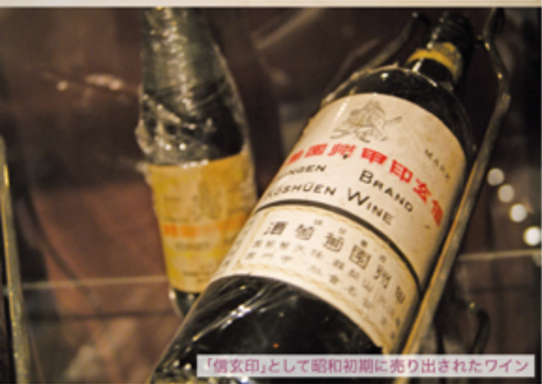
「信玄印」として昭和初期に売り出されたワイン