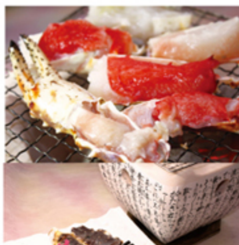
たらば蟹と春野菜の炭火焼