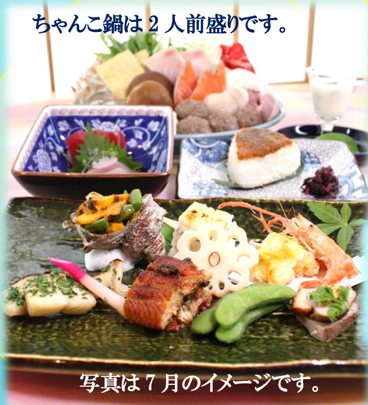
写真は7月のイメージです。