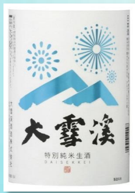
大雪溪 特別純米生酒