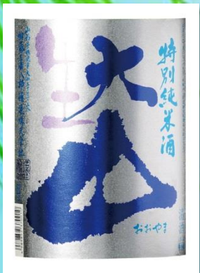
大山 特別純米生酒