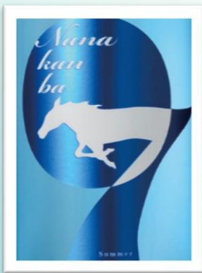
七冠馬 純米吟醸夏 SEVEN

今年のテーマは「生酒」。 40年前は味わうことも難しかった、特有の清涼感と主張してくる酒らしさを、是非お楽しみください。