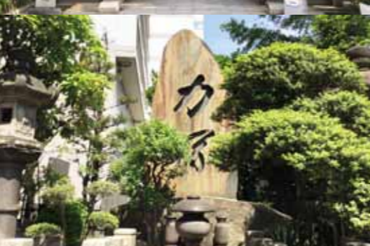
境内にある「力塚」、1936年に歴代相撲年寄の慰霊のために建立