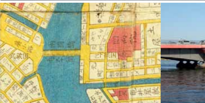
二つの国を結んだ「両国橋」（分間江戸大絵図完 安政6年）