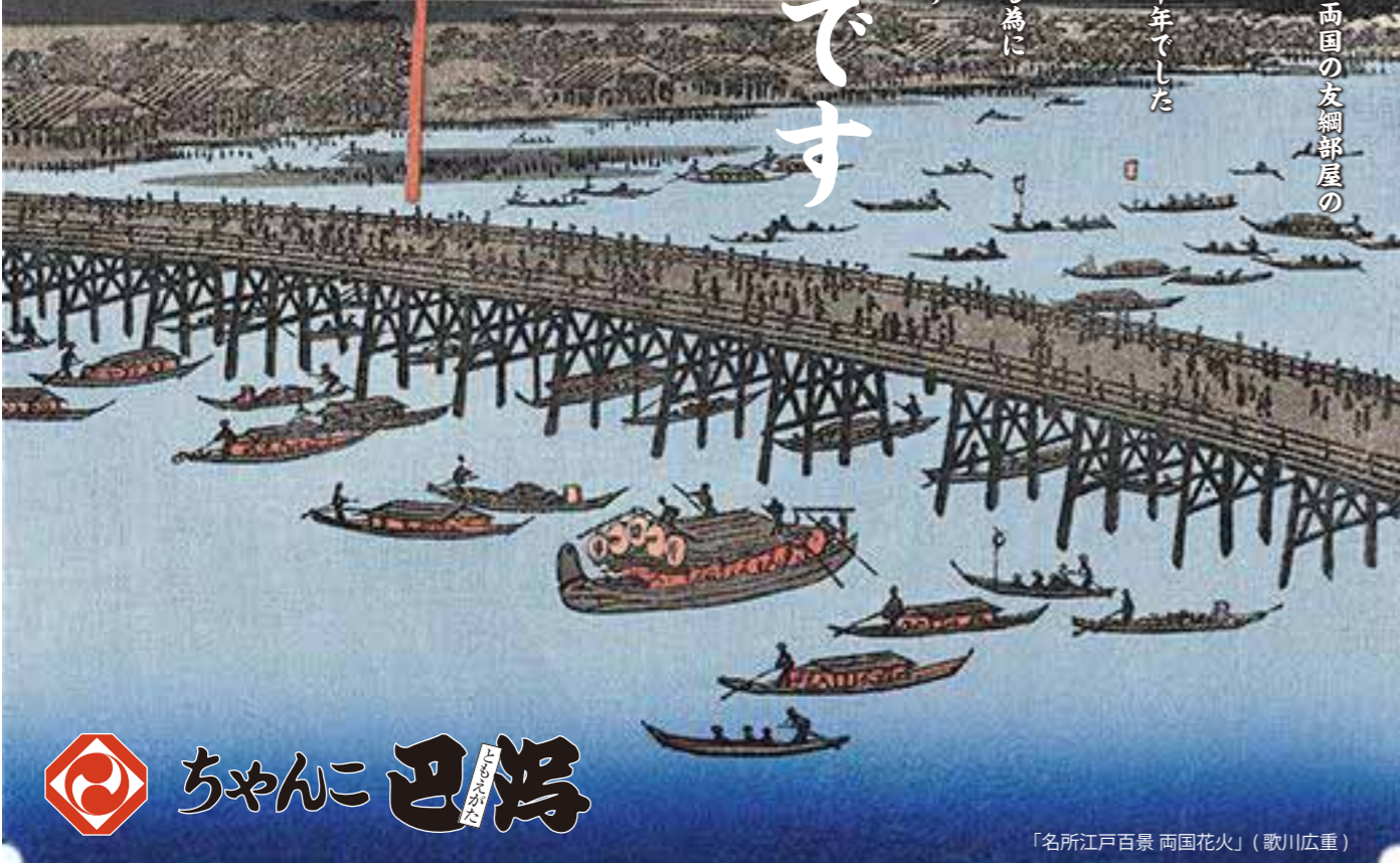
「名所江戸百景 両国花火」(歌川広重)