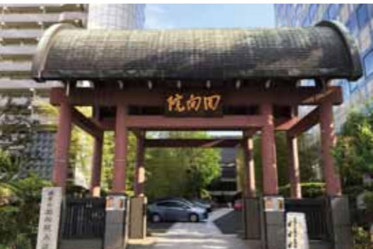
回向院の山門、江戸時代は隅田川に面したように表門がありました