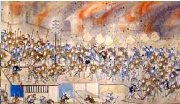
明暦の大火を描いた田代幸春の「江戸火事図巻」（江戸東京博物館所蔵）