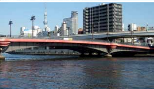
江戸時代よりも50mほど上流に竣工された現在の両国橋（1932年竣工）