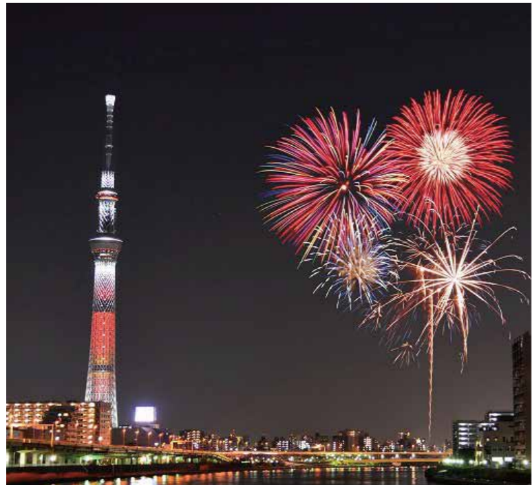
「両国花火大会」は江戸の夏を彩る一大イベントでした