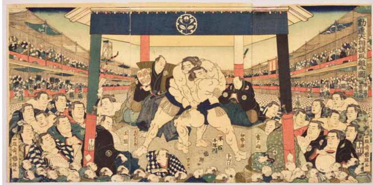
一雄齋国輝「勸進大相撲取組之図」(回向院所蔵)