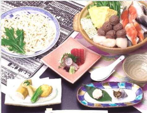
前菜・刺身(2点盛)・一品・ 海鮮みそちゃんこ鍋・うどん