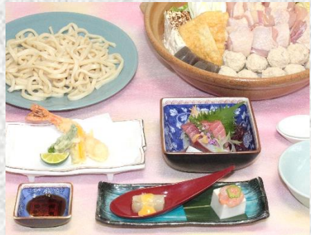
前菜・刺身(2点盛)・一品・ 鶏肉とつみれちゃんこ鍋 ・うどん