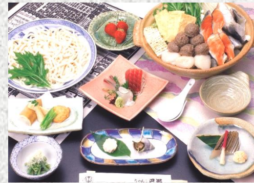
先付・前菜・刺身(3点盛)・二品 海鮮みそちゃんこ鍋・うどん・水菓子