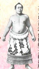
太刀山 第22代横綱 友綱部屋