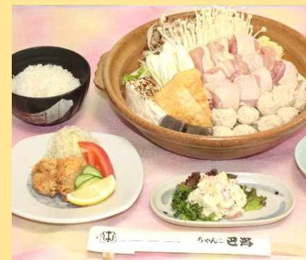
ちゃんこ鍋は A: いわしつみれ入海鮮みそちゃんこ鍋 B: 鶏つみれと鶏肉の醤油ちゃんこ鍋 いずれかよりお選びください。