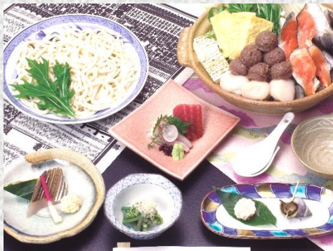
先付・前菜・刺身(2点盛)・一品 海鮮みそちゃんこ鍋・うどん・水菓子