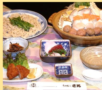
ちゃんこ鍋は 四大ちゃんこより お選びください。